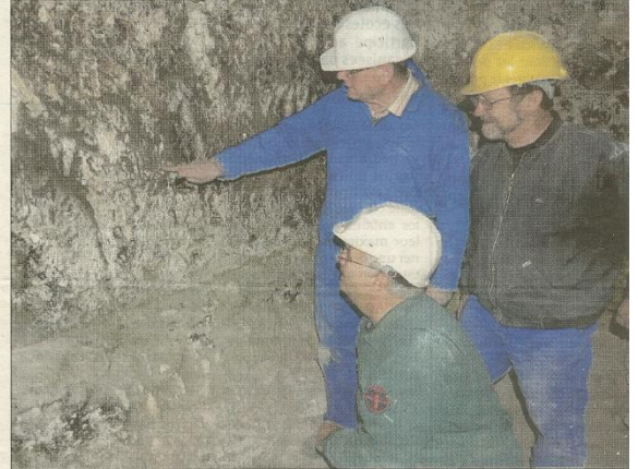
Les membres des Vieilles Pierres ont mené 15 jours de fouilles à la grotte du sabotier et ont trouvé des graffiti intéressants.