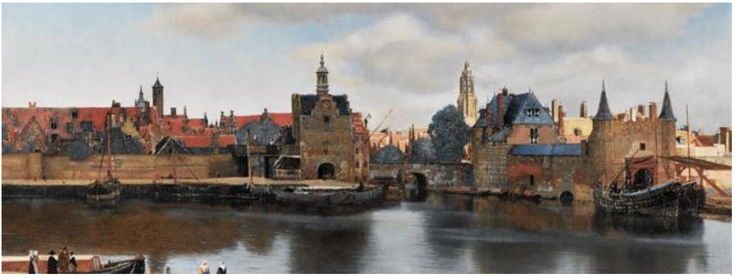
Vue de Delft Johannes Vermeer