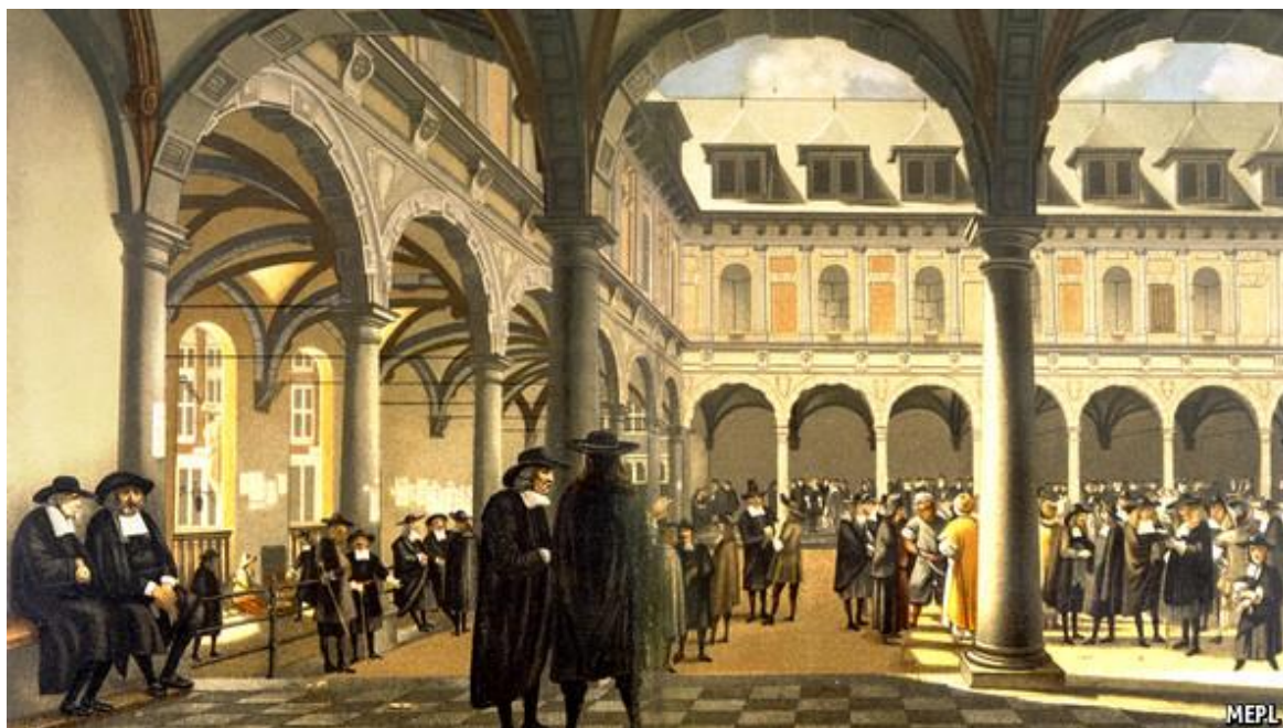
Compagnie néerlandaise des indes orientales (VOC)