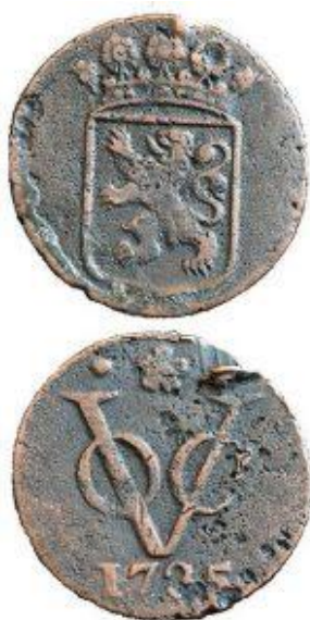
Monnaie frappée par la VOC Crée le 20 03 1602

Les 46 piliers de la cour intérieure sont numérotés pour qu'on sache où se tiennent les marchands.