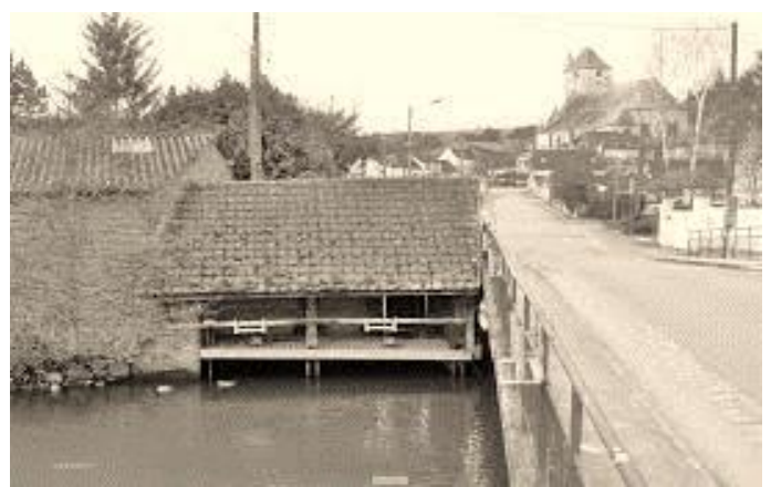
Vue du lavoir dit « Le Gué » en 1900 et vers 1970 avant restauration

Celui dit « le gué » était lui fréquenté par les laveuses d'Ivry mais également par celles de la Couture Boussey qui ne bénéficiaient pas d'un cours d'eau. Une charrette à cheval descendait le linge des laveuses. Les laveuses dites « professionnelles » d'Ivry considérant que leur place leur était réservée en amont cela déclenchaient souvent de féroces prises de bec entre elles.