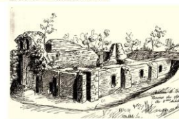
Dessins relevés des ruines durant les fouilles