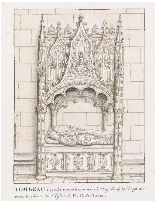
TOMBEAU à gauche, contre le mur dans la Chapelle de la Vierge des rivers, la Chapelle de l'Église de N. D. de Rouen.

Travaillant et vivant dans l'entourage de la Maison d'Anjou, qui représente la cause nationale face à un gouvernement parasite, il joue un rôle actif dans le renversement de Georges de la Trémoille, ce qui lui vaut d'être nommé Sénéchal d'Anjou dès 1437 et du Poitou en 1440. Homme du roi Charles VII, dont il est le ministre de 1443 à 1449, et bien qu'il soit tenu en disgrâce et perde de son influence en 1450 à la mort d'Agnès Sorel, il garde une activité politique remarquable en tant que Gouverneur de la Normandie et Directeur des relations de la France avec l'Angleterre. A la mort de Charles VII en 1461, Pierre de Brézé est emprisonné par le nouveau roi Louis XI qui se venge de ses anciens rivaux. Il est libéré un an plus tard en raison de sa qualité d'homme de guerre, et à la condition que son fils Jacques épouse Charlotte de Valois. Ayant accepté, il participe en Angleterre en faveur de Marguerite d'Anjou épouse de Lancastre, à la Guerre des Deux Roses qui oppose la Rose Rouge de Lancastre à la Rose Blanche de York, mais l'invasion s'avérant inefficace il se replie en Ecosse, où il mène plusieurs expéditions dans le Nord de l'Angleterre.