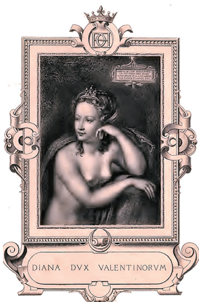
Diane de Poitiers

C'est l'année suivante qu'elle fit construire ce magnifique Château, si vanté dans l'histoire, et qui reste un des plus beaux types de la Renaissance Française.