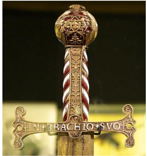
Epée de François Ier dite de « Pavie »

Puis viennent les épées de Cour dans de riches fourreaux mais elles restent des armes d'apparat que la noblesse exhibe. En Orient, l'arme reste le sabre, au Japon médiéval le katana.